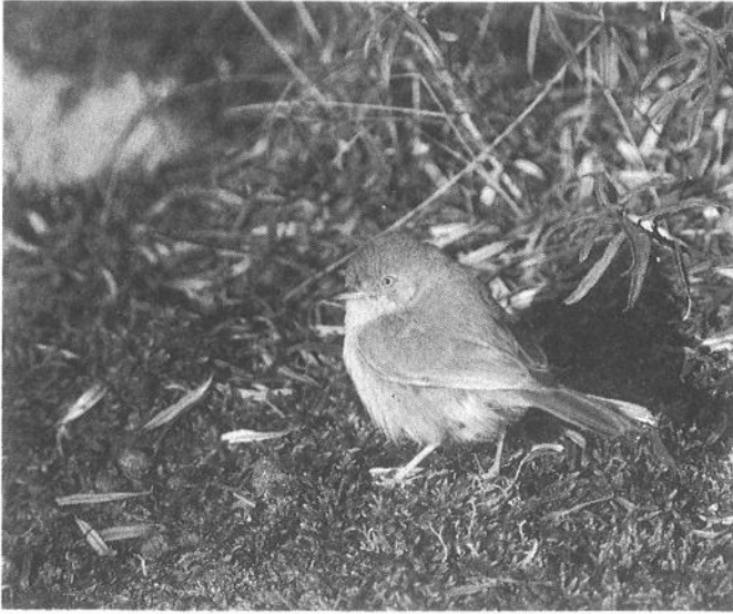
6 Woestijngrasmus Sylvia nana , AW-duinen, Noord-holland, 3 november 1988 (Arnoud van den Berg)

lipdam 2 en een Rosse Stekelstaart Oxyura Jamaicensis in de Haagse Waterleidingduinen 2h en vloog een Slechtvalk over de Erasmus Universiteit in Rotterdam 2h.