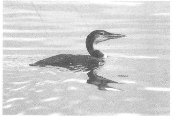
5 IJsdruiker Gavia immer , Bussloo, Gelderland, 30 oktober 1988 (Ronald Groenink)

Kleine Kokmeeuw L. philadelphia bleven aanwezig bij de zuidpier van IJmuiden Nh. Vanaf 25 oktober was de traditionele adulte Grote Burgemeester L. hyperboreus aanwezig aan de binnenzijde van de Brouwersdam Zh. Een vermeende Armeense Meeuw L. argentatus armenicus die op 19 september bij Zutphen Gld werd gemeld, lokte in oktober en november vele Laro-logen die echter geen van allen de vereiste kenmerken konden vaststellen. Enkele IJsvogels Alcedo atthis verbleven de gehele maand november in De Horsten bij Wassenaar Zhen in de AW-duinen Nh. Overige nagekomen waarnemingen uit oktober waren die van een mogelijke Kuhls Pijlstormvogel Calonectris diomedea op de 31e op Terschelling Fr en van een Amerikaanse Spotlijster Mimus polyglottos die zich van de 16e tot de 23e gemakkelijk liet waarnemen op Schiermonnikoog. De kleine invasie Pestvogels Bombycilla garrulus wordt op pagina 5 uit de doeken gedaan.