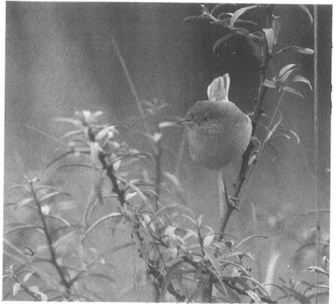
2 Woestijngrasmus Sylvia nana , AW-duinen, Noordholland, 31 oktober 1988

Natuurlijk had ik ook weer geen agenda met telefoonnummers bij mij, maar ik kon de telefoonboeken van het bezoekerscentrum gebruiken. De Dutch Birding -vogellijn was uiteraard steeds in gesprek, in Alphen a/d Rijn waren vele vd Burgen, in Sant-