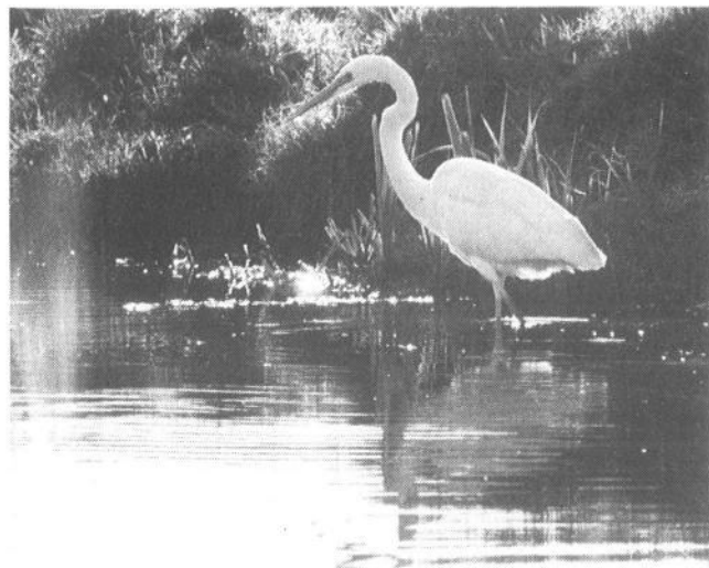
8 Grote Zilverreiger Egretta alba , Alblasserwaard, Zuidholland, 21 november 1988 (Hans Gebuis)

Langs de Oostvaardersdijk ter hoogte van kilometerpaal 23.5 zat op de 19e en de 20e tussen Bonte Strandlopers Calidris alpina een juveniele Amerikaanse Gestreepte Strandloper C melanotos . Op de 19e zat ook een 15-tal Grutto's Limosa limosa langs de Oostvaardersdijk en vanaf deze datum een Rosse Stekelstaart ter hoogte van de Blocq van Kuffeler Fl en een Waterspreeuw op landgoed Rozendaal bij Velp Gld. Op Schiermonnikoog werden een eerste-winter Grote Burgemeester , in totaal drie Middelste Jagers , een tiental IJseenden en 13 Kleine Alken gezien. Een andere Kleine Alk bevond zich langs de zuidpier van IJmuiden. Ook werden de afgelopen dagen vijf IJseenden gezien op een grindgat ten oosten van Maaseik Bl. Op deze plek zaten ook twee vrouwtjes Amerikaanse Smient die op de 20e van een derde exemplaar werden vergezeld. Op de vinkenbaan van Castricum Nh werd een Witstuitbarmsijs gevangen. De vogel bevond zich in een groep van 20 Grote Barmsijzen Carduelis flammea flammea . Bij Alphen aan den Rijn Zh zat een IJsvogel , in de achterhaven van Dudzele-Zeebrugge weer twee Buidelmezen , over recreatieplas Het Rutbeek bij Enschede O vloog een Boerenzwaluw en over Amersfoort U 15 Kraanvogels . Tot de 21e zat er een Grote Zilverreiger in het kreekje De Holle Mare ten zuiden van Zwartewaal Zh.